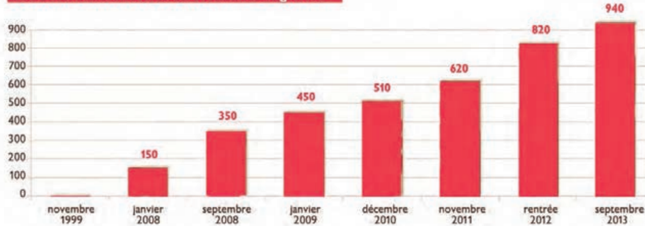
Le nombre d'orchestres en croissance régulière

Nous avons reçu 51 dossiers de demande de subvention de la part des porteurs. Nous avons financé 35 orchestres répartis sur 25 départements pour une somme totale de 253 000 €