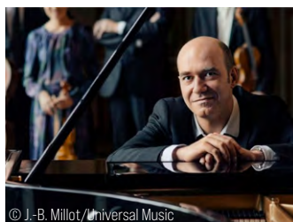
© J.-B. Millot / Universal Music