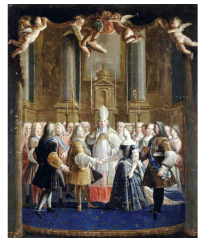
Le Mariage de Louis XV et de Marie Leszczyńska dans la chapelle de Fontainebleau

En septembre 1725 , le château de Fontainebleau a tout d'un opéra du XVIII e siècle. Le roi Louis XV, âgé de quinze ans, épouse au château la princesse polonaise Marie Leszczyńska. L'union a lieu dans la chapelle de la Trinité du château, la musique du Roi s'éteignant en amphithéâtre dans la tribune, remplissant l'air de ses fanfares : trompettes, hautbois, timbales et violons annoncent l'arrivée du cortège nuptial. Le diadème de la reine, criblé de diamants, saphirs, rubis et émeraudes pèse si lourdement sur la tête de la jeune souveraine qu'elle frôle le malaise. Les deux époux sont unis par le cardinal prince de Rohan, évêque de Strasbourg, revêtu de la chape et de la mitre.