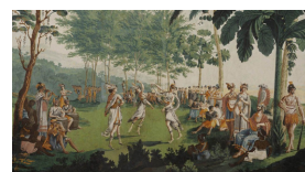
Les Sauvages de la mer du Pacifique, encore appelé Les Voyages du capitaine Cook ou Paysages indiens est un papier peint panoramique dessiné par Jean-Gabriel Charvet

Les Indes galantes symbolisent l'époque insouciant, raffinée, vouée aux plaisirs et à la galanterie de Louis XV et de sa cour. Elles établissent définitivement Rameau comme le maître du spectacle lyrique de son temps.