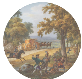
Assiette de porcelaine : le carrosse du roi entouré d'Amérindiens chamarrés, coiffés de plumes et vêtus de peaux de bêtes, qui s'éparpillent dans la forêt de Fontainebleau.

Le 22 novembre, la délégation quitte Paris pour Fontainebleau, où se trouve la cour et le roi qui y résident depuis le mariage. La rencontre est attendue avec impatience des deux côtés. La mode est en effet à l'exotisme américain. Le 27 novembre 1725, Louis XV leur octroie à Fontainebleau une audience particulière . Chaque chef reçoit, des mains du souverain, une médaille et une chaîne en or, une « belle montre à répétition, garnie de diamants », un fusil, une épée. Puis, Louis XV leur offre un petit divertissement : « une chasse au lièvre » en forêt de Fontainebleau. Passionné de chasse, le roi de France est curieux des techniques de vénerie indienne. Les autochtones d'Amérique chassent aussi un cerf « à leur façon, c'est-à-dire à la course » plutôt qu'à cheval. La chasse de Louis XV et des Amérindiens marque les esprits et figurera dans les événements historiques retenus pour le service historique de Fontainebleau, fresque historique miniature d'assiettes de porcelaine enluminées, commandée par le roi Louis-Philippe pour la « galerie des Assiettes » (1833/35).