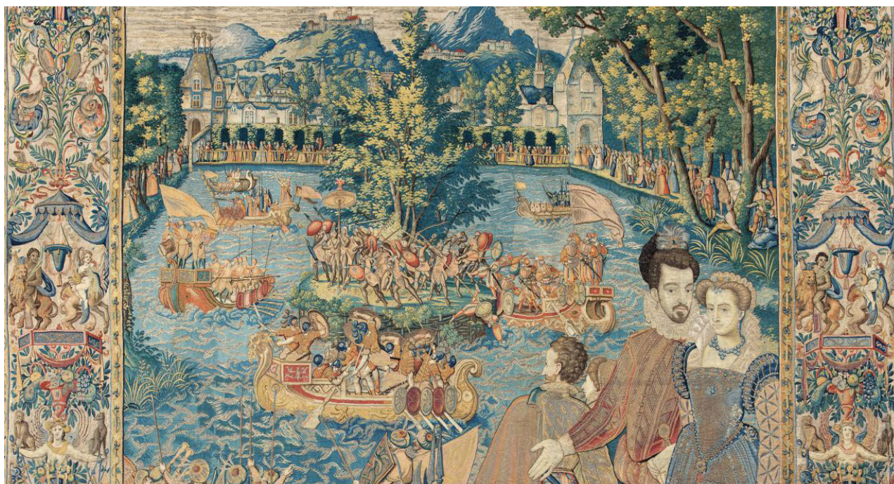
La Tenture des Valois

vous invitent à fêter Les Indes galantes de Jean-Philippe Rameau