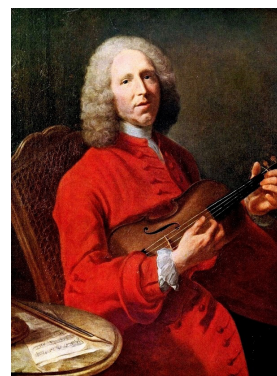
Portrait de Jean-Philippe Rameau attribué à Joseph Aved (vers 1728)

Déménagée de Fontainebleau, la scène se déroule dans une forêt d'Amérique du Nord. La jeune indienne Zima, courtisée par le français Damon et l'espagnol Don Alvar, est amoureuse de l'indien Adario. La « danse du grand calumet de la paix », inspirée de ce que le compositeur a pu voir à Fontainebleau, met en scène « le guerrier à la découverte de l'ennemi, armé d'un arc et d'un carquois garni de flèches, pendant qu'un autre est assis par terre et bat du tambour ou espèce de timbale pas plus gros que la forme d'un chapeau ». Fontainebleau résonne depuis de la musique de Rameau : « Forêts paisibles, jamais un vain désir ne trouble nos cœurs... »