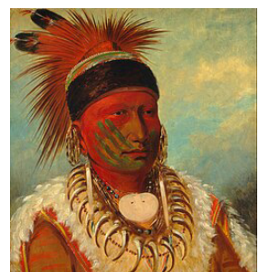
Le chef MU-hu-She-kaw (le nuage blanc) de George Catlin

Dans la continuité du mariage, un second événement hautement musical a lieu durant ce séjour d'automne à Fontainebleau. En 1724, la Compagnie des Indes organisait la venue d'une délégation amérindienne à la cour . L'explorateur Vénart de Bourgmont, de retour d'Amérique, va présenter au jeune roi, un groupe d'autochtones d'Amérique qu'il a ramenés avec lui du Missouri. « On leur a fait voir ce qu'il y a de plus curieux à Paris, et ce qu'ils y ont le plus particulièrement remarqué, sont les chaudières et les broches de la cuisine des Invalides, lesquelles étaient si bien garnies, qu'ils demandèrent s'il y avait assez de guerriers pour manger toutes ces viandes ».