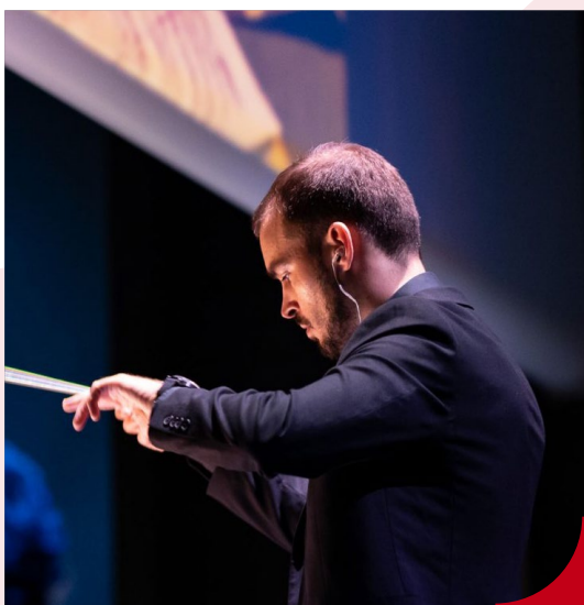
Dimitri Soudoplatoff

Création originale commandée par Radio France et composée par Dimitri Soudoplatoff pour Orchestre à l'École.