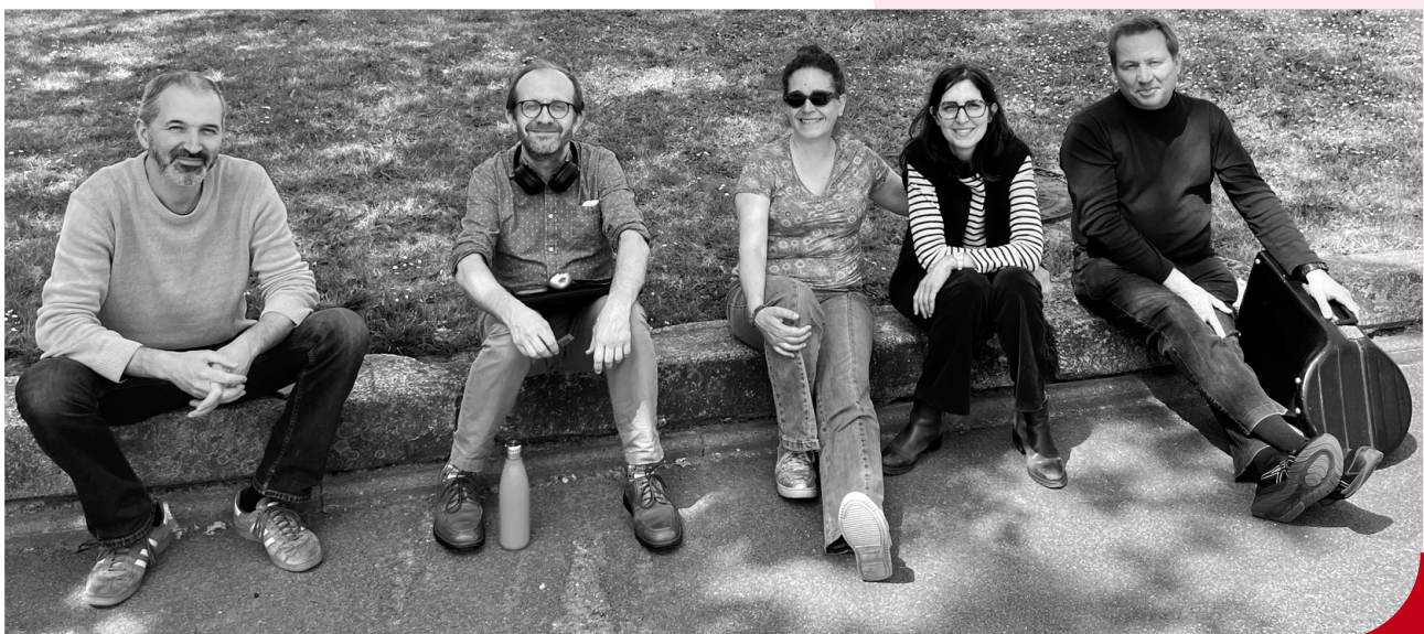
Les musicien·nes-tuteurs lors du stage à Montaigu-Vendée